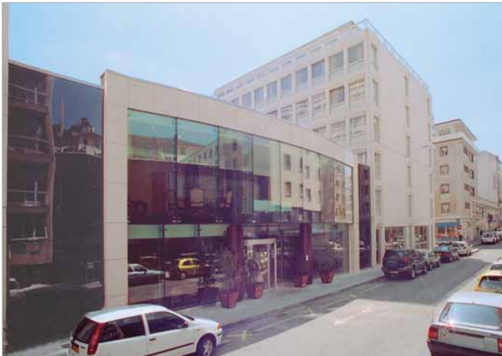
Vue de l'entrée