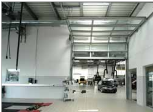
Accès à la zone atelier