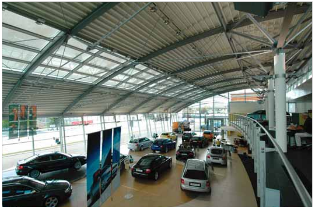
Vue générale de l'espace exposition avec la présentation de l'ensemble des modèles de la marque

Chemin du Viaduc 1 1000 LAUSANNE 16 Tél. 021 621 81 70 www.fourniersteiner.ch