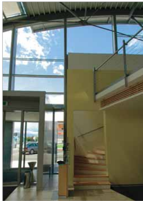
... soutenue par le noyau en béton armé