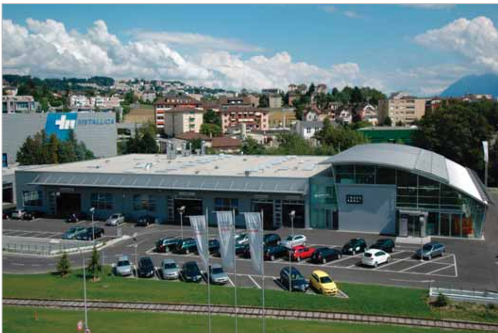
Vue générale du nouveau Centre Audi de Suisse romande

Longueur du bâtiment principal : 80 m Largeur du bâtiment : 40 m Surfaces brutes de planchers : 11'800 m 2 Volume SIA : 41'000 m 3 Prix total : Fr. 14'350'000.- Prix m 3 SIA (CFC 2) : ca. Fr. 350.-/m 3