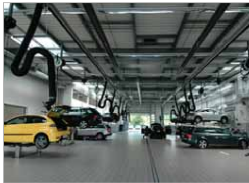
Poste de travail éclairé zénithalement