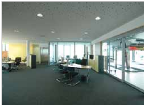
Réception directe en dialogue avec le client