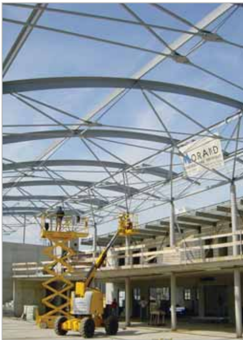
Pose de la structure métallique...