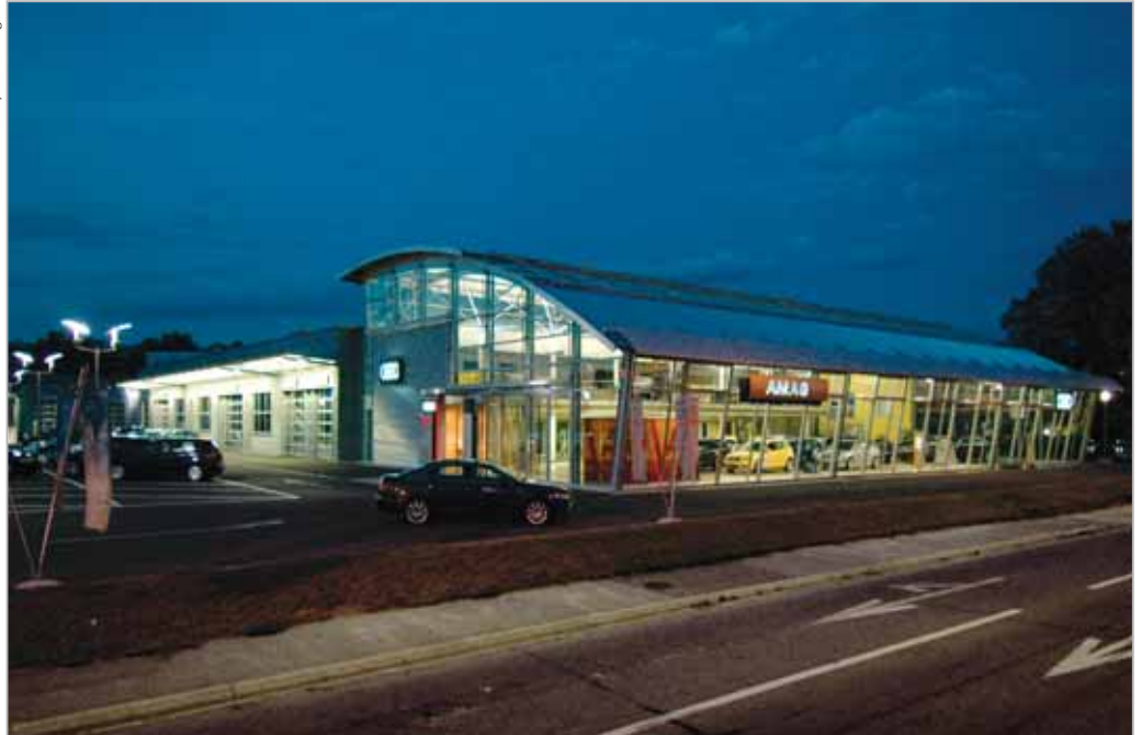
L'architecture du nouveau Audi Center Crissier attire inévitablement le regard

Afin de palier aux besoins de la clientèle et à l'exiguïté du garage de Lausanne, AMAG s'est porté preneur d'une parcelle de 12'000 m 2 à Crissier. Sur ce terrain, emplacement stratégique par la proximité immédiate